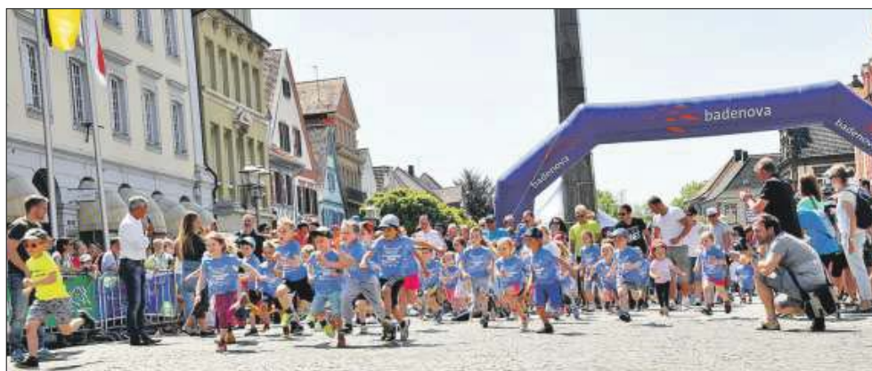
Bambinilauf. Seit 2005 sind auch die Kleinsten am Start.