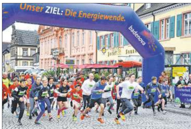
Laufbegeisterte aller Altersgruppen sind willkommen.